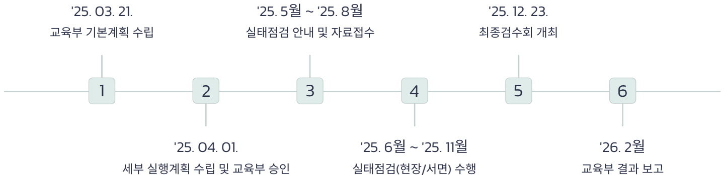
<'25년 재외 한국학교 실태점검 추진 경과>